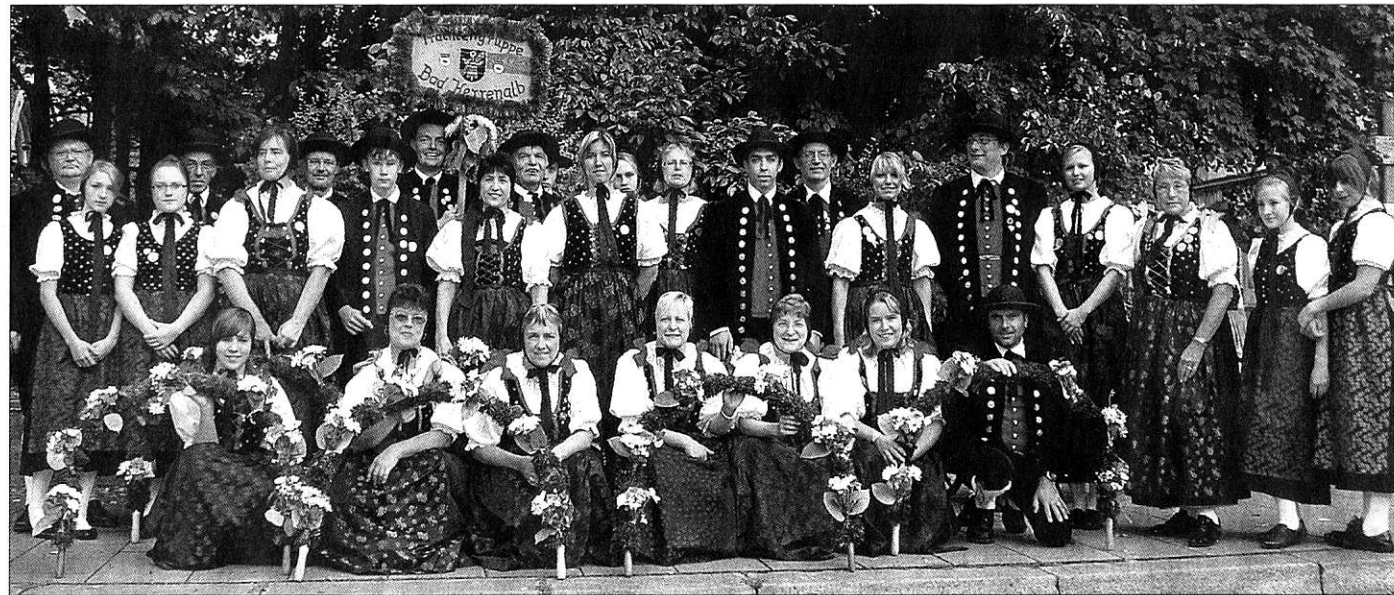
Die Trachtengruppe aus Bad Herrenalb feiert ihr 40-jähriges Bestehen.

Mit wie vielen Zuschauern am Straßenrand rechnen Sie?